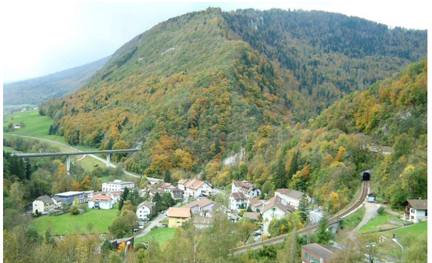
Blick über Frinvillier

Frinvillier gehört zur Gemeinde Vauffelin, welche am 1. Januar 2014 mit Plagne zur neuen Gemeinde Sauge fusionierte. Frinvillier liegt 532 m.ü.M. und ist dank dem Autobahnanschluss an die Transjurane für Pendler optimal gelegen. In rund 10 Minuten erreicht man bereits den Bahnhof Biel (mit Auto oder ÖV). Auch Richtung Moutier/Porrentruy, Solothurn oder Neuchâtel profitiert man von guten Verbindungen. Mit rund 450 Einwohnern (Stand 31. Dezember 2013) gehört Vauffelin/Frinvillier zu den kleineren Gemeinden des Berner Juras. Von den Bewohnern spricht der Grossteil Französisch. Die Schule wird gemeinsam mit den Dörfern Plagne und Romont geführt. Die Kinder werden mit gut organisierten Bussen zur Schule gefahren. Die Sekundarschule wird in Biel besucht. Die wohl bekannteste Sehenswürdigkeit der Region, ist die atemberaubende Taubenlochschlucht. Nur wenige Gehminuten vom Dorfkern Frinvilliers entfernt, betreten Sie eine faszinierende Naturwelt, die den Alltag rasch vergessen lässt.