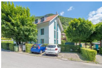
Wohnhaus mit Aussenparkplätzen