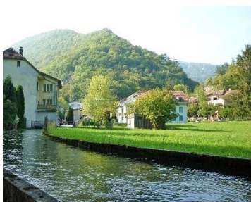
Schüsskanal und Chasseralausläufer

Weitere Infos finden Sie unter: www.plagne.ch www.taubenloch.org www.taubenlochstrom.ch www.biel-seeland.ch