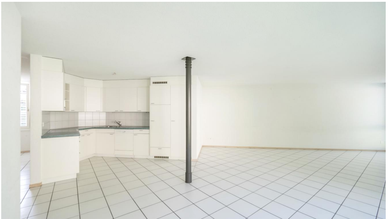
Wohn-/Essbereich mit offener Küche

Die Wohnung verfügt über einen grosszügigen Wohn-/Essbereich, der dank grossen Fensteröffnungen von viel Tageslicht profitiert. Die offene Küche ist mit grossem Kühlschrank mit Gefrierfach, Glaskeramikherd, Backofen und Geschirrspüler ausgestattet. Die drei gemütlichen Zimmer sind mit einem pflegeleichten Laminatboden belegt.