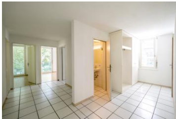
Entrée / Flur

Die charmante Wohnung befindet sich im 1. Obergeschoss (ohne Lift) eines 6-Familienhauses. Ruhig und idyllisch gelegen, profitiert man von der Nähe zu Natur, Wald und Naherholung. Die Taubenlochschlucht befindet sich nur wenige Fusschritte entfernt. Dank der verkehrstechnisch guten Erschliessung gelangt man rasch Richtung Moutier/Porrentruy, Solothurn, Neuenburg oder Biel (ca. 10 Minuten mit ÖV oder Auto bis Biel).