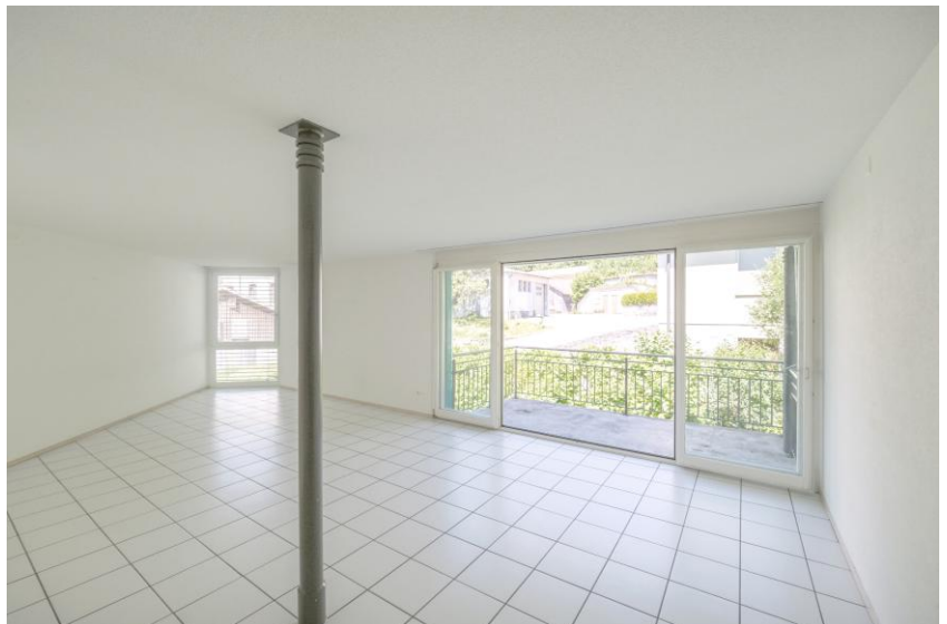
Heller Wohn-/Essbereich mit offener Küche

Sehr ruhige und idyllische Wohnlage. Nähe Wald und Naherholungsgebiet. Charmante Wohnung im 1. OG (ohne Lift) mit rund 104m 2 Wohnfläche. Offene Küche, Bad + Gäste-WC, Einbauschränke, Balkon, grosser Keller, 1 Aussenparkplatz, Waschküche, Spielplatz und Grillplatz zur Mitbenützung, Baujahr 1993.