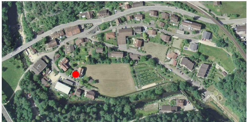
Lage rue du Canal 7 in 2535 Frin villier