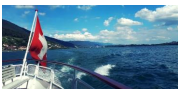
Schiffsfahrt auf dem Bielersee