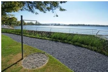
Aussendusche zur Mitbenützung