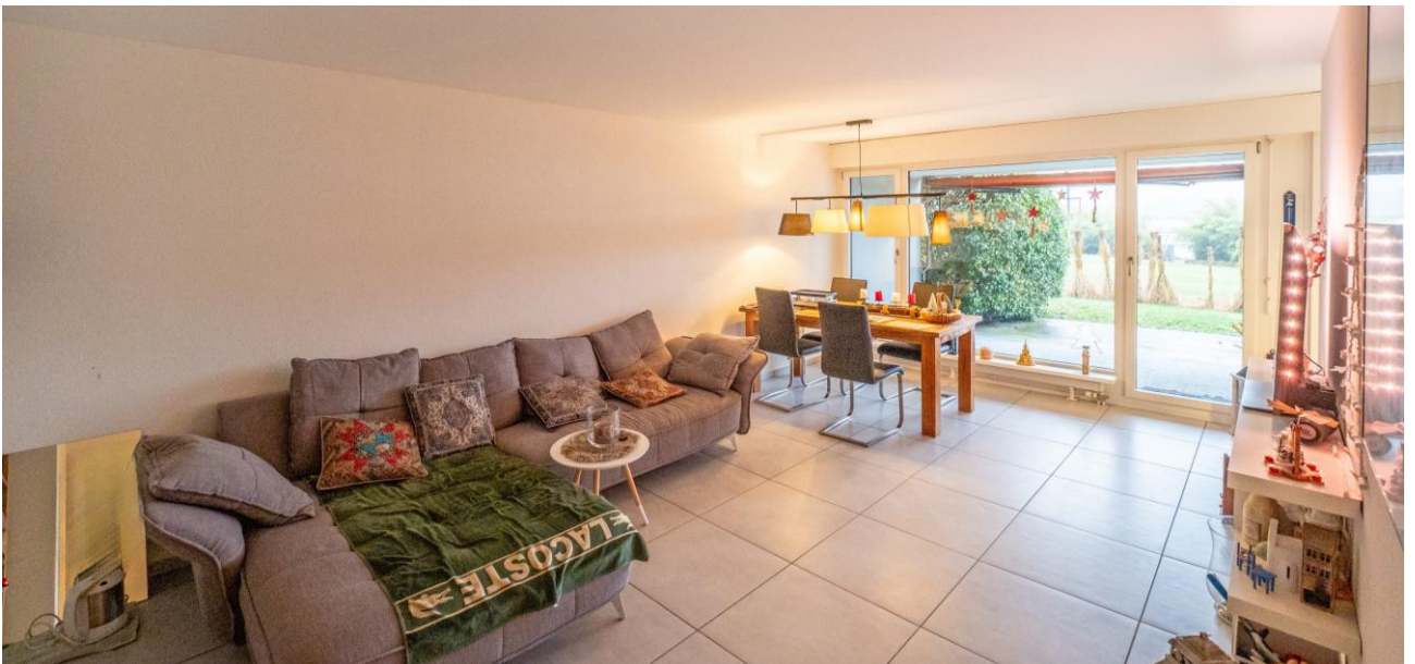
Wohnbereich mit davorliegender Terrasse

Die im Erdgeschoss gelegene 2½-Zi.-Gartenwohnung überzeugt durch ihre gepflegte und äusserst grosszügige Gestaltung. Im Eingangsbereich stehen praktische Einbauschränke zur Verfügung. Der Wohnbereich ist mit Bodenplatten belegt und führt zur davorliegenden Terrasse. Mit dem Schiffshorn und den Seevögeln im Hintergrund erleben Sie eine einmalige Ferienstimmung!