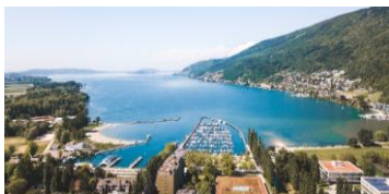
Rebberge bei Ligerz am Bielersee