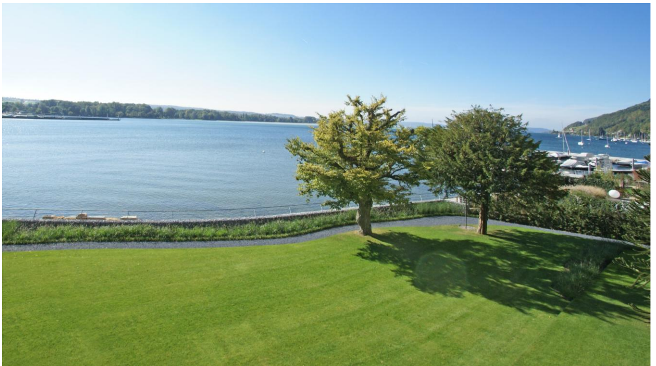
Unverbaubarer Ausblick auf den Bielersee (Drohnenfoto)

Direkt am Seeufer mit unverbaubarer Aussicht! Grosszügiger Grundriss mit rund 72m 2 Wohnfläche im Erdgeschoss, offene Küche, Eichenparkett, Bad mit italienischer Dusche/WC/Lavabo + Sep.-WC, Einbauschränke, zwei Terrassen mit Seesicht, Keller. Private Seewiese zur Mitbenützung und direkter Zugang zum See.