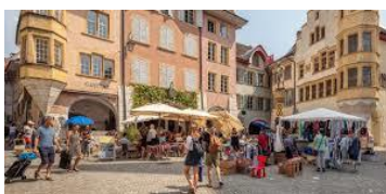
Altstadt - Biel