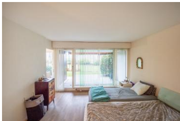
Zimmer 1 mit Terrassenzugang & Seesicht

Nebenan befindet sich die offene, mit Glaskeramik und Granitsteinarbeitsfläche ausgestattete Küche mit aussichtsreichem Essplatz und Terrassenzugang.