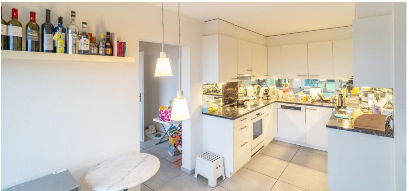
Küche in zeitlosem Design

Es ist ein exklusiver Wohnraum an spektakulärer Lage, wo Sie sich schnell zu Hause fühlen werden!