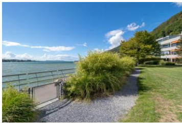
Ausblick auf See und private Liegewiese