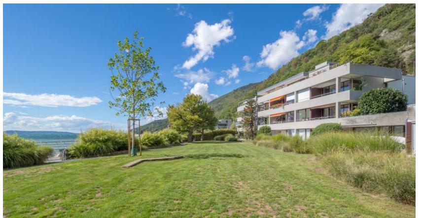
Private Liegewiese direkt am See zur Mitbenützung