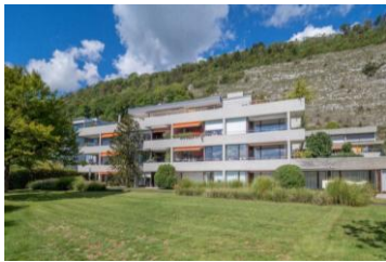
Mehrfamilienhaus mit Liegewiese