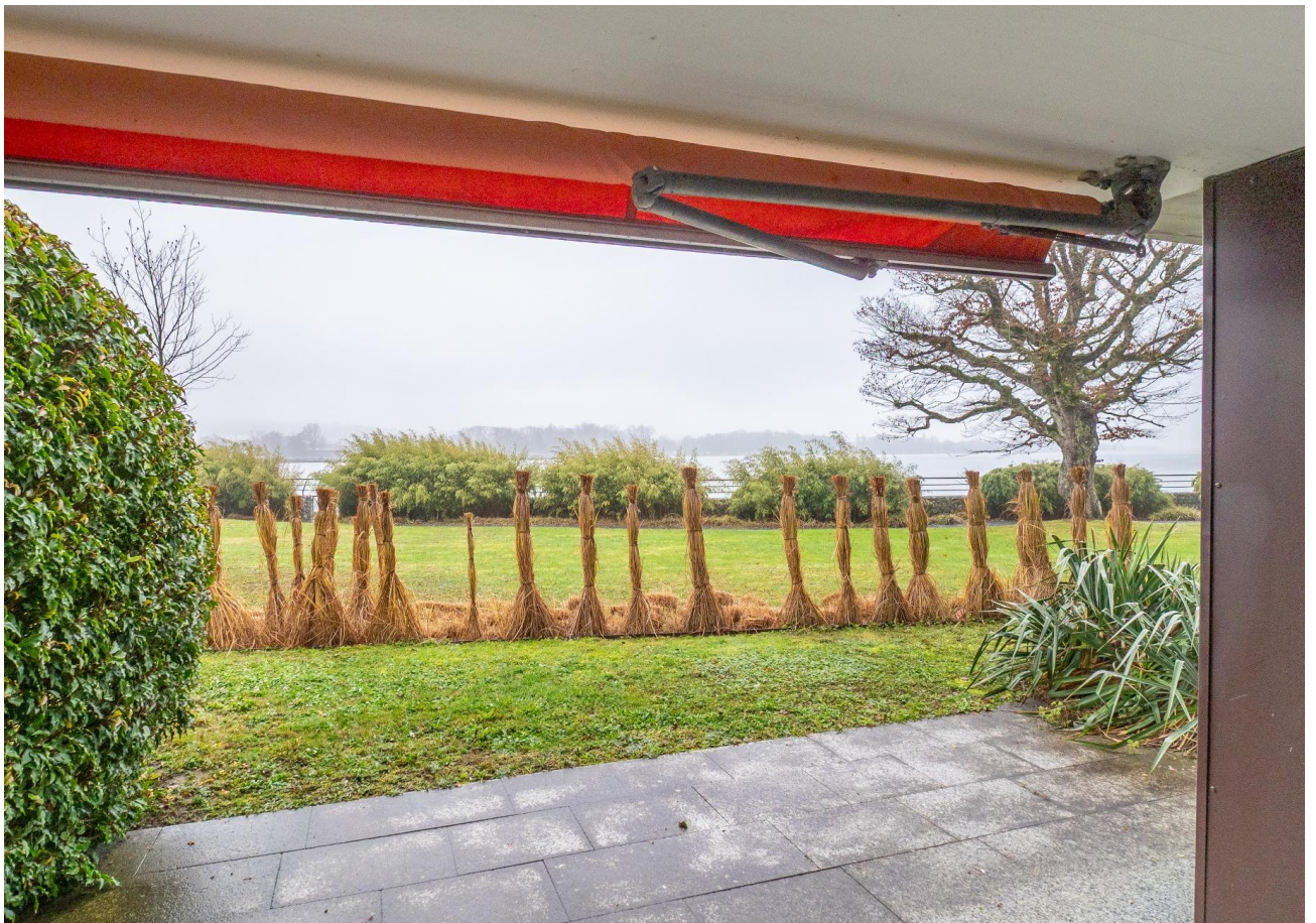
Ferienstimmung auf der Terrasse