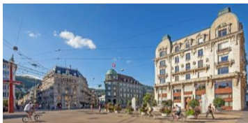
Stadt – Biel/Bienne